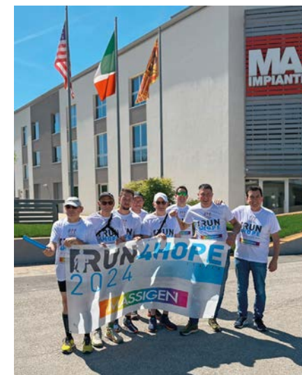
I gruppi aziendali impegnati nella Run4Hope